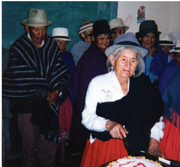
Ancianita de San Cristóbal en su homenaje

tura lo guardan en su corazón, y así la tradición oral en San Cristóbal aun se mantiene viva y pujante.