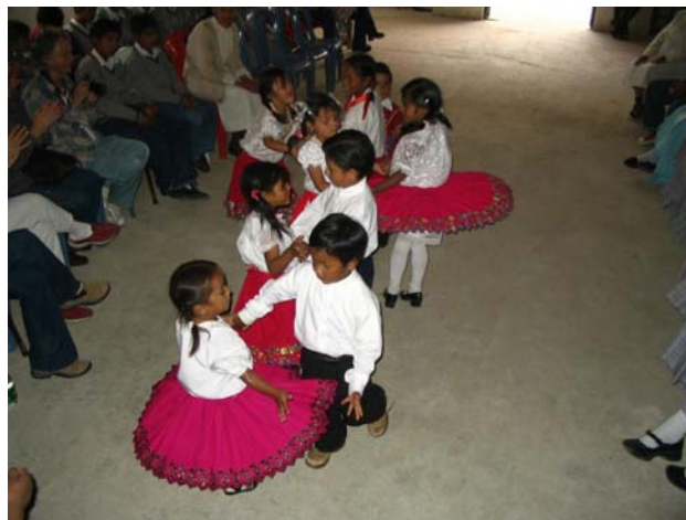
Niños del Cuchito