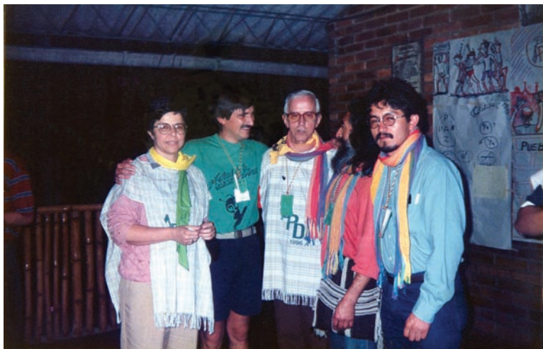
Asamblea Pueblo de Dios 1993 Con Don Pedro Casaldaliga