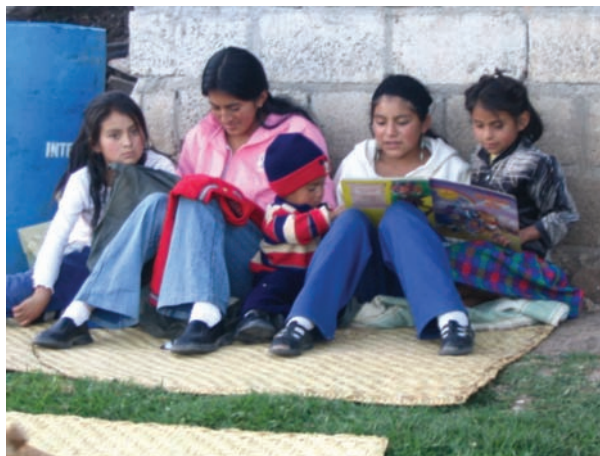
Niños leyendo cuentos en la biblioteca

Era común escuchar frases tales como: “Les están haciendo filáticos” , “Ya no quieren trabajar ahora quieren jugar” , “están cuestionando a los padres y profesores, levantando la voz” . De alguna manera ya tenían voz, y lograban darse el tiempo para soñar en ser doctores, maestros, líderes, profesionales, se imaginaban un futuro mejor. Al decir de Martín Luther King LOS SUEÑOS COMENZABAN A SER REALIDAD.