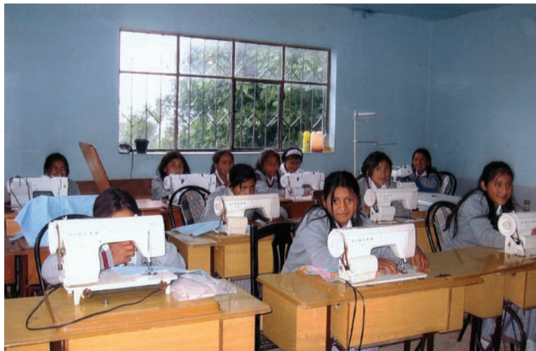
Aula de corte y confección del Centro de Formación Integral Provenir

Al no existir ningún colegio en la parroquia, esta experiencia se convirtió en la única oportunidad de capacitación para los jóvenes de la comunidad durante ya diez años consecutivos.