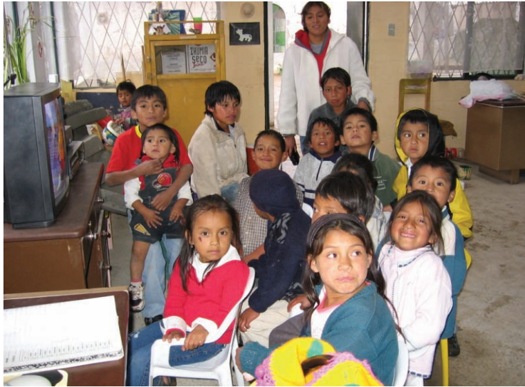
Niñas y niños en la biblioteca comunitaria

lización de los niños/as con dinámicas y actividades creativas que incentivan la motivación y la confianza.