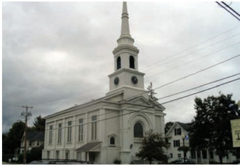
Templo de la UCC Bethany Church Randolph - EEUU

Nuestra relación se basa en profundos lazos de amistad y confianza, nacidos de la experiencia de compartir los sueños y las reflexiones sobre el Evangelio para construir una comunidad de compañeros de un mismo proyecto, el de defender la vida, en donde la solidaridad no es entendida como caridad paternalista o compasiva, sino como identidad en lucha por una vida mejor para todos y todas.