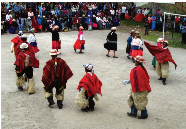
Danza tradicional cañari

La zaragua: danza que representa también el juego mestizo entre el indio y el blanco. Tanto la escaramuza, la contradanza y la zaragua están conformadas por un grupo sin límite de personas. Todas ellas recogen una expresión de las relaciones raciales y son realizadas únicamente por los indígenas.