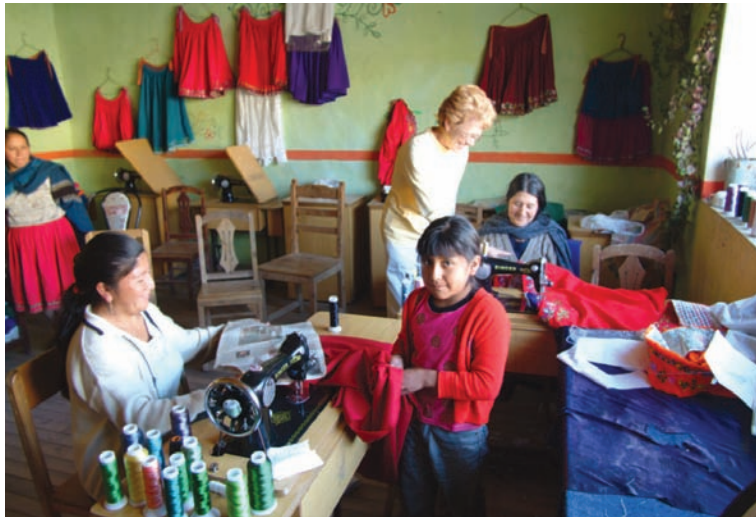
Taller de bordados “Los Rosales”

El grupo trabajó también en la producción de sombreros de paja toquilla, una de las actividades a través de las cuales la mayor parte de las familias de la parroquia han sido explotadas por varias décadas. Con el apoyo de la Iglesia Unida de Cristo de Vermont Estados Unidos, organizamos un centro de acopio para comercializar directamente los sombreros hacia los EE.UU., hasta que desde Randolph nos contaron que en ese pueblo del norte hasta los perros y los gatos ya tenían sombreros de San Cristóbal. Inundamos su mercado a través de un comercio justo y directo.