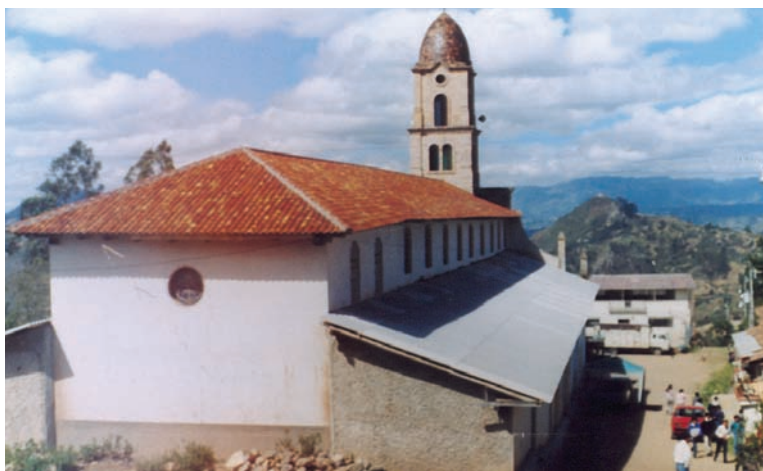
Refacción del techo del templo central

El Obispo de Spayer, con su generosidad permitió culminar el cambio de la cubierta de nuestra capilla, al mismo tiempo, nuestro agradecimiento a Mónica Bossung por su incondicional apoyo.