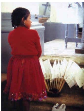
Niña macetera

Las fiestas son el espacio donde la gente recobra su orgullo y su protagonismo, y porque no también de alguna manera su independencia al expresar con alegría lo que siente el corazón y expresa la profundidad de su ser, su identidad histórica y ancestral.