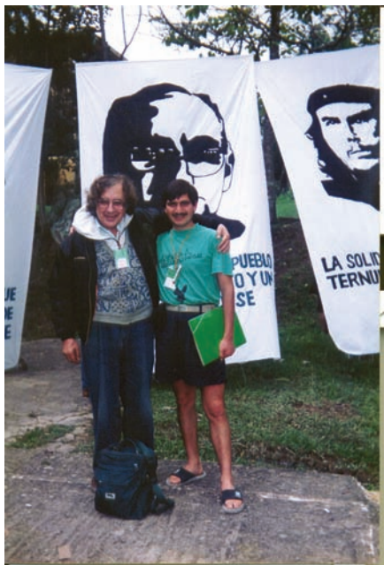
Asamblea Pueblo de Dios 1993 Con Giulio Gerardi