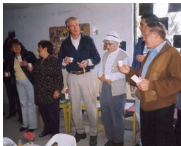
Inauguración de la biblioteca