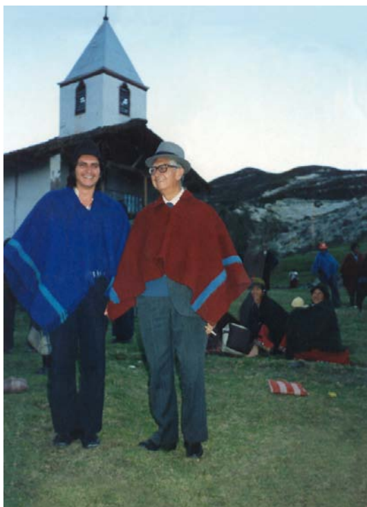
Monseñor Leonidas Proaño con Pepe

Padre nuestro Padre nuestro, no eres Dios que se queda es su cielo, tu alientas a los que luchas para que llegue tu Reino. Padre nuestro que no guardas nunca contra nadie venganza o desprecio que te olvidas de ofensas y agravios y pides que todos también perdonemos Padre nuestro Padre nuestro, no eres Dios que se queda es su cielo, tu alientas a los que luchas para que llegue tu reino