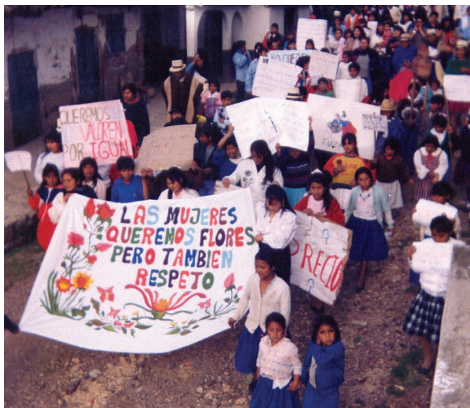
Estudiantes del Centro Porvenir en marcha por conmemoración del 8 de marzo