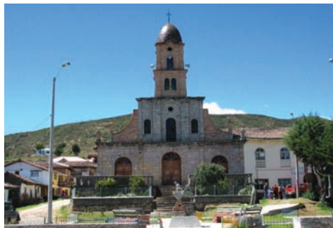
Iglesia Central de la parroquia San Cristóbal