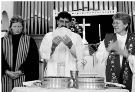
Compartiendo una celebración dominical ecuménica en Bethany Church - Randolph