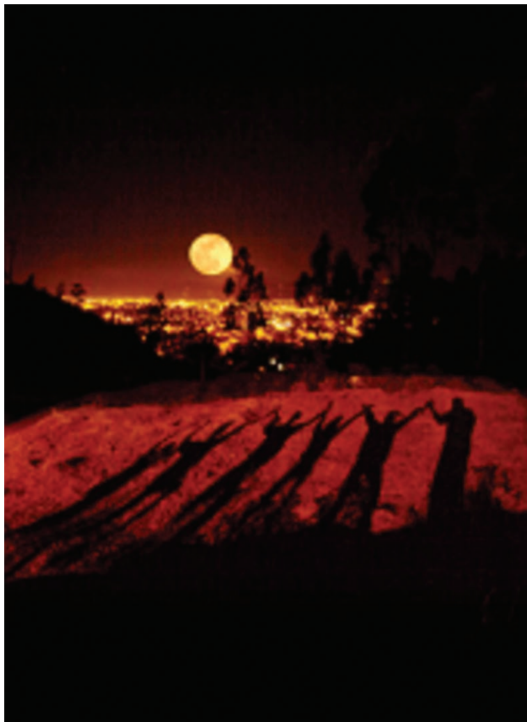
Fotografía de Roberto Eddy, titulado “Luna de las Américas”, primer premio Tikkum OLAM, Agosto de 2006. (La fotografía recoge la plenitud de la Luna Llena de Septiembre sobre las luces de la ciudad de Cuenca, en un momento de oración compartida entre los amigos de Randolph y San Cristóbal)