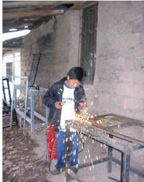
Taller de metal mecánica

nivel, con el área de electricidad y se profundiza en la práctica de metal mecánica. En Agosto 2002, se graduó la primera promoción en esta especialidad.