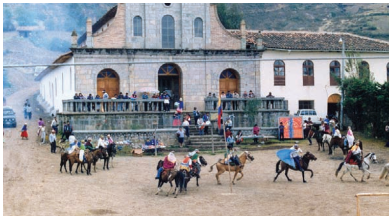
Tradición de la escaramuza