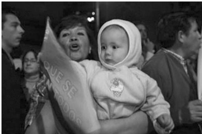
El Comercio, 20 de abril de 2005, Sección A2 Especial. Familias enteras, en que destaca la presencia de las mujeres, salieron a las calles a manifestar su rechazo al régimen de Gutiérrez.