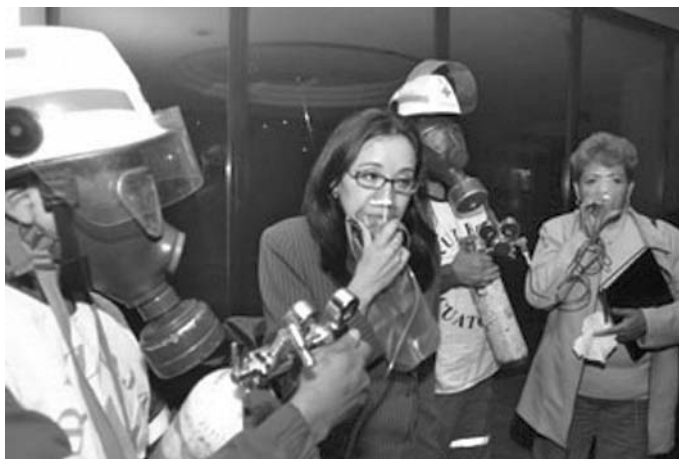
El Comercio, 24 de marzo de 2005, Sección A2. Diputadas socialcristianas fueron asistidas luego de que estallaran dos bombas en el Salón del Pleno.