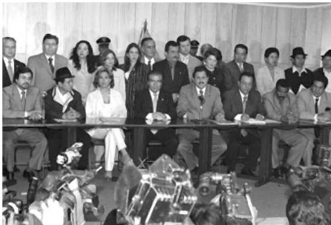
El Comercio, 5 de noviembre 2004, Sección A1. Cincuenta diputados pertenecientes a los bloques de ID, PSC, MPD y Pachakutik firman el pedido para enjuiciar al Presidente Gutiérrez.