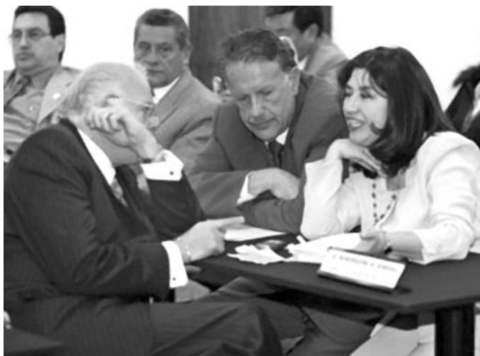
El Comercio, 7 de diciembre de 2004, Sección A2. Miembros de la alianza PRE-PSP para cesar a la Corte Suprema de Justicia.