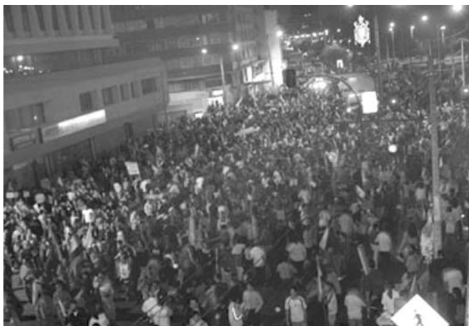
El Comercio, 20 de abril de 2005, Sección A2 Especial. La mayor protesta popular contra Gutiérrez, una autoconvocatoria ciudadana.