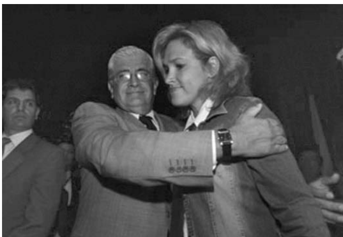
El Comercio, 21 de abril de 2005, Sección A2.. Alfredo Palacio, luego de ser posesionado por la primera Vicepresidenta del Congreso, Cynthia Viteri.