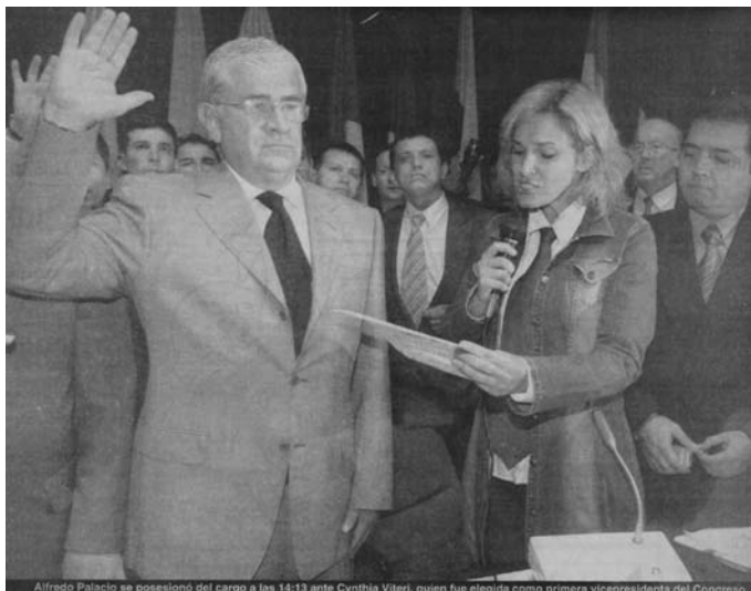
Alfredo Palacio se posesionó del cargo a las 14:13 ante Cynthia Viteri, quien fue elegida como primera vicepresidenta del Congreso.