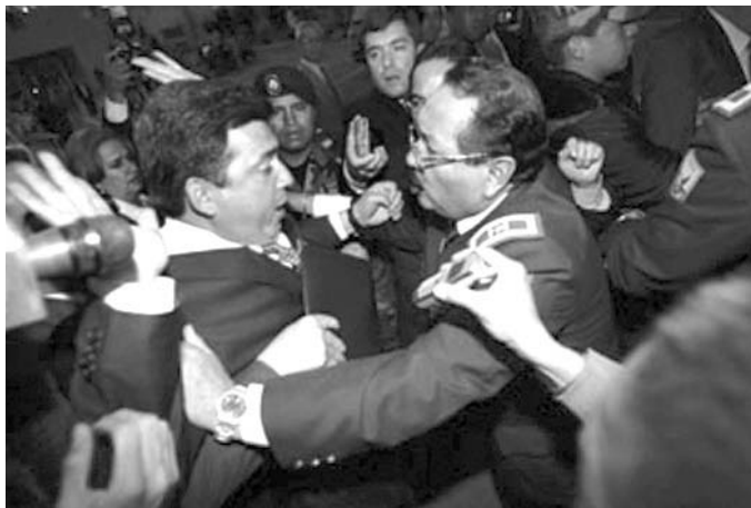
El Comercio, 17 de noviembre de 2004, Sección A2. Escenas de violencia en el Congreso. Diputados de oposición y afines al gobierno se enfrentaron a golpes por denuncias de “compra” de conciencias.