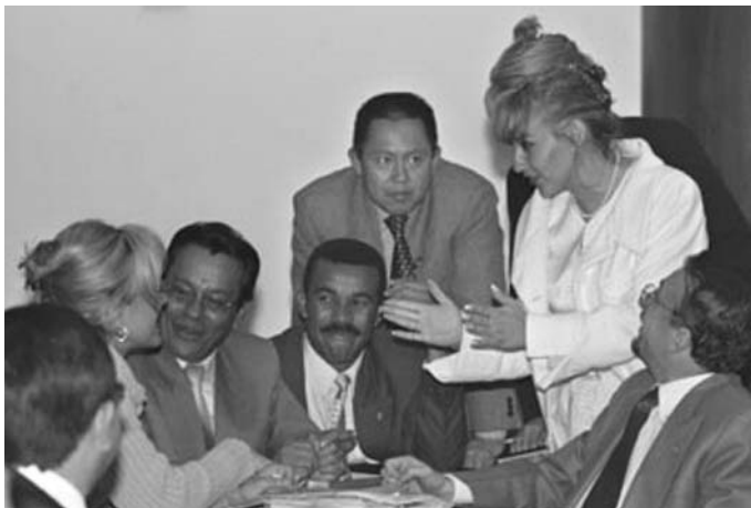
Intercambio informal entre diputados y diputadas de diferentes bloques.