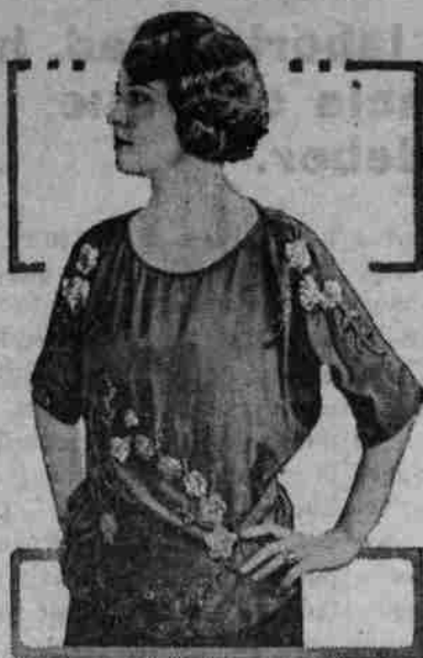
Entre las Blusas con Adornos de Abalorio

Una de las blusas más hermosas que estarán en boga este Otoño es el estilo con el cual ilustramos el grabado. Está hecha de Crepé de China adornada con ricos encajes con cabezas de abalorio. Las mangas cortas con el extremo algo más ancho que el cuerpo de toda la manga, y el cuello redondo con un pequeño o delgado respunte en la parte superior o sea para remachar.