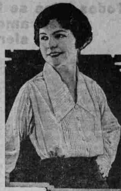
La verdadera Camisa-Blusa

La verdadera camisa blusa está hecha de algodón, seda lavable o de linón. Su estilo aparece en cada estación y es propia para las señoras o señoritas que son afectas a los "sports" y para usarlas con vestidos lisos estilo sastre. El último estilo es el que representa este grabado y está hecha de cotón y alforzas bajas en el frente y en el cuello y puños. Los botones son de perla.