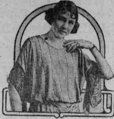
Blusas de Cuentas

La elegancia y arte no consiste en usar costosísimas sedas y cuen-tas de piedras preciosas. La sim-plicidad y el buen gusto superan a todas estas cosas. Blusas de cuen-tas como la que ilustro aquí, he-chas de crepé de chine y georget-te, adornados con cuentas con toda simplicidad pero con el gusto artístico en su propio lugar, for-man un estilo de la última moda. La blusa suelta, para el tiempo ca-liente, con manga ancha y bordada de cuentas con artísticos diseños, el escote regular y con listas de cuentas en el cuerpo, forman la más elegante y al mismo tiempo simple de la estación.