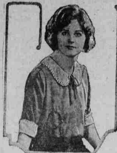
Crepé y Velo de Seda

Esta blusa está hecha de crepé y velo de seda con simples adornos de cuentas. Su estilo es uno de los de última moda. El cuello está hecho de velo de seda igual que los puños de las mangas cortas. El escote no es indecente, y muy recom-endable y apropiado para las señoritas y señoras de buen gusto y que les agrada la elegancia del estilo. Como lo muestra la ilus-tración es un estilo apropiado para salir de casa, para las tertulias o sean "parties" y reuniones noc-urnas, todas las damas y damitas de elegancia y comodidad las usan y las consideran sus blusas favori-tas.