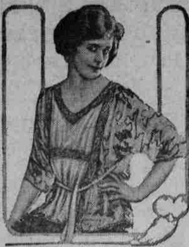
Crepé y Cuentas

Aparece en los últimos estilos que se hallan no solo en los comer-cios de las ciudades grandes del Estado, sino que en los comercios de nuestro hermoso y pintoresco Taos, que el "crepé georgette" y las cuentas han sido hechas para la confección de las más eie-gantes blusas. La anterior ilus-tración con que engalano estas li-neas, muestran que las blusas he-chas de este material no solo son elegantes y de buen gusto sino que propias para la estación y de la última moda. Las amantes de lo elegante y propio hallaran en la anterior ilustración un modelo.