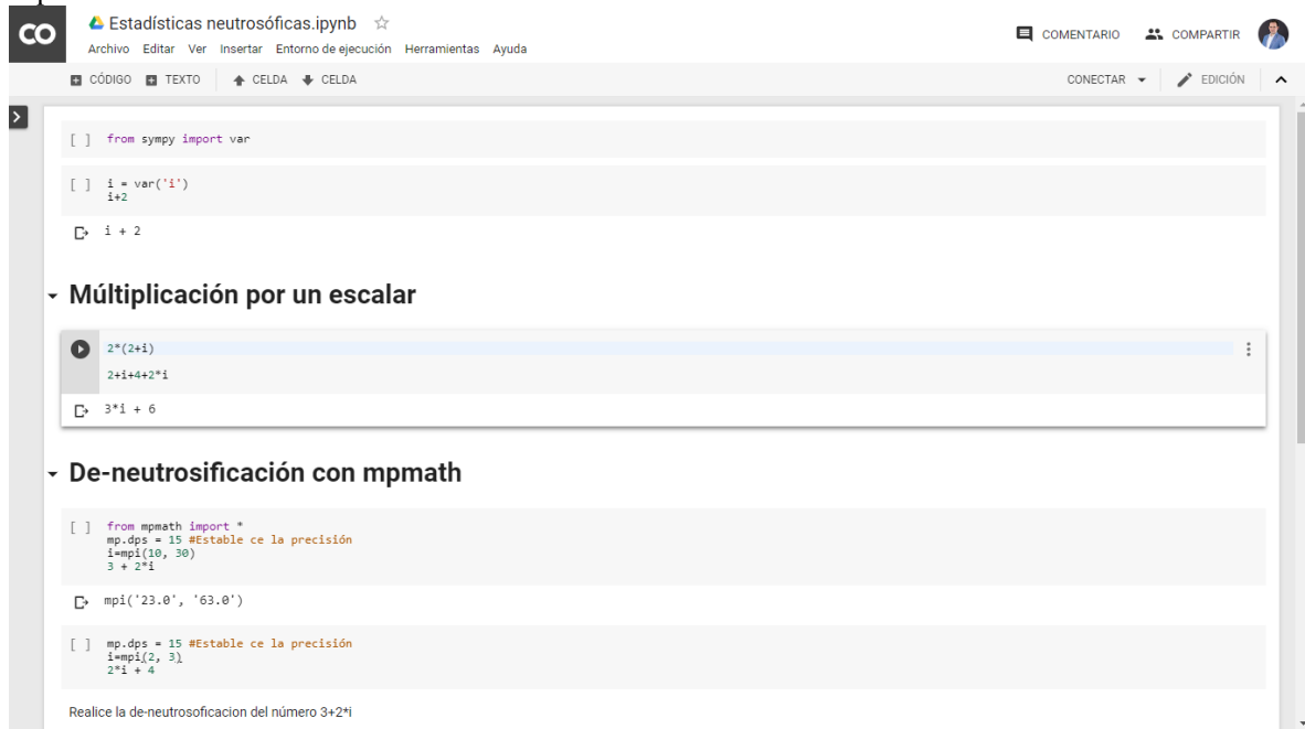
Figura 2. Google Colaboratory

En el transcurso de presente libro se abordará implementaciones prácticas de la propuesta. Google Colaboratory es una aplicación web que permite crear y compartir documentos que contienen código, fuente, ecuaciones, visualizaciones y texto explicativo tal como se muestra.