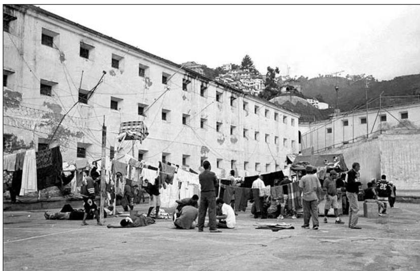
Pabellón B

divididas en: Tratamiento, Jurídico, Educativo, Diagnóstico, Seguridad y la Dirección, todas localizadas en la fachada del edificio.