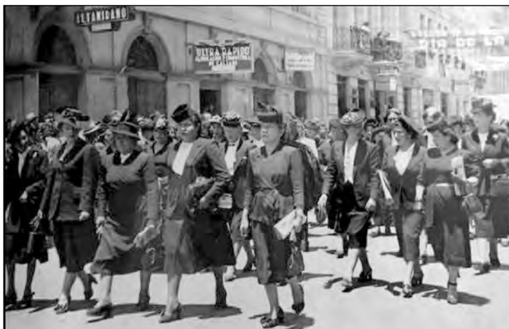
Fig. 28. Desfile.

Hay que señalar también que estas imágenes austeras y nítidas de las maestras fueron parte del ceremonial educativo: de los desfiles en las calles junto a sus educandas (Fig. 28); de los aniversarios patrios en las escuelas; de los actos, veladas y ceremonias donde se pronunciaban discursos, se honraba los símbolos nacionales y se ponían condecoraciones. Ningún espacio secular estaba tan ritualizado como la escuela, pero ese ritual servía, al mismo tiempo, como recurso para la afirmación del maestro y la maestra en el campo educativo, así como de las capas medias en el campo social.