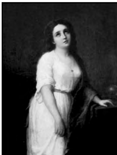
Fig. 3. Dama quiteña, óleo de comienzos de siglo. Anónimo.

La mujer vive y reina unida al hombre, como hija, como esposa o como madre, especialmente desde que la sublimó el Cristianismo. Dios al crearla puso en su rostro la belleza, en su alma la sensibilidad, en su pecho el cariño; cubriéndolo todo con el velo del pudor, segunda religión del bello sexo... (Mora 1904)