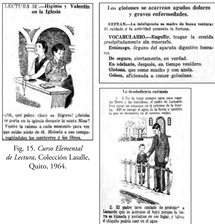
Fig. 15. Curso Elemental de Lectura , Colección Lasalle, Quito, 1964.

nuestro medio destinadas, fundamentalmente, a las escuelas fiscales. Lo que interesaba era ubicar a los niños en relación a una tradición y, al mismo tiempo, a los nuevos requerimientos de la vida social, generar nuevas formas de ser y a la vez desarrollar un sentido nacional.