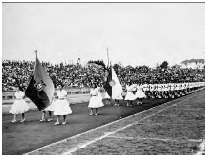
Fig. 30. Desfile escolar. Biblioteca Colegio Manuela Cañizares.

normalista para las obreras que deseaban adquirir o ampliar sus conocimientos. La creación de extensiones para obreras respondía al ideal reformista de esos años 23 . Se trataba de difundir los conocimientos adquiridos, preparando a las obreras para el trabajo moderno y para su responsabilidad como madres. Las materias que recibían eran: normas fundamentales de higiene, economía doméstica, puericultura y mecanografía, así como enseñanzas necesarias para el desempeño en almacenes y otras oficinas o departamentos de comercio. De este modo, las maestras estaban buscando una incorporación ventajosa de mujeres de sectores medios y populares al mundo del trabajo y un manejo racionalizado del hogar.