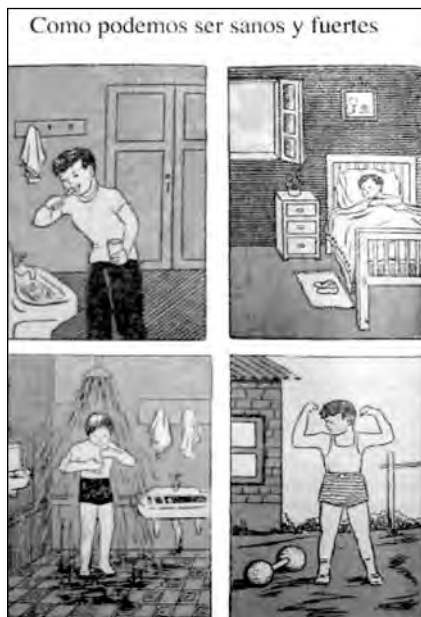
Fig. 13. Caminitos de Luz , Libro de lectura de segundo grado.

tante fue la introducción de dispositivos administrativos (registro de profesores, escalafón y ficha de los profesores, informes impresos de labores) de medición del rendimiento, conducta y condiciones de los niños, así como de sus condiciones de salud.