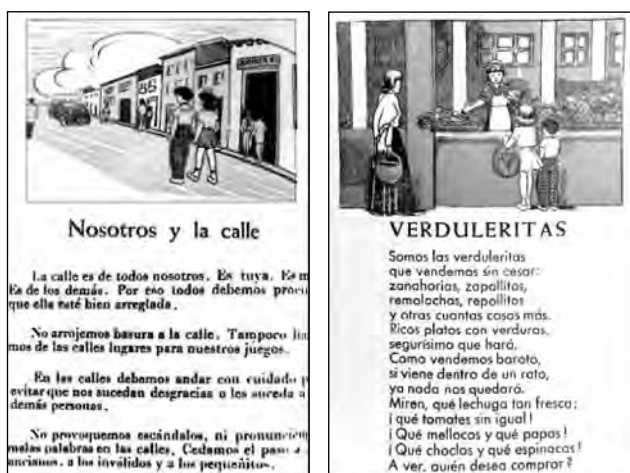
Fig. 16. Caminitos de Luz , Libro de Lectura de segundo grado.

Si se comparan estas imágenes con las del libro Jilgueritos se observa que el niño lejos de ser forzado a adquirir hábitos higiénicos y a ser avergonzado por los profesores, los asume autónomamente. En ese mismo texto escolar se discute, por ejemplo, la relación entre los niños y la calle. “La calle es de todos nosotros y por eso debemos cuidarla”. En realidad el problema fue más allá de los textos utilizados y se conectaba con lo que se podría denominar un habitus pedagógico. Me refiero a la relación vertical entre maestro y estudiantes, la supremacía del libro y de la escritura, el aprendizaje memorista y el sistema de premios y castigos. Todo esto estaba (y en parte está) incorporado al sentido práctico de los maestros y no podía ser transformado de la noche a la mañana. La educación activa, como escuela pedagógica intentaba, sobre todo, la generación de dispositivos educativos que cambiaran esas prácticas y esa era la función de los textos escolares.