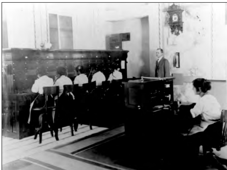
Fig. 5. Telefonistas, 1916.

ca (Fig. 5). Esto no quiere decir que los antiguos roles de las mujeres como madres y esposas desaparecieran, pero hubo el intento de que se secularizaran en función de la ideología liberal del progreso y de las nuevas formas de control del cuerpo social y de los individuos.