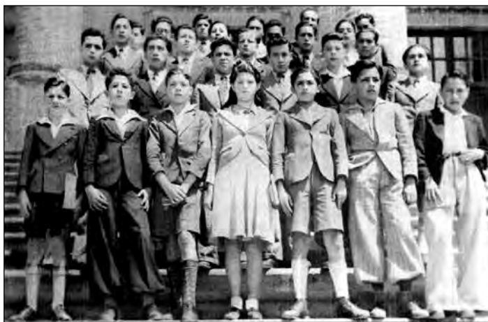
Fig. 9. La estudiante del colegio Mejía.

tema tenía muchas ventajas ya que estaba en perfecta armonía con lo que sucedía en todos los momentos de la vida social contemporánea, donde “se considera a hombres y mujeres como trabajadores de valor idéntico en la sociedad humana, llamados a laborar juntos, a ayudarse mutuamente en la lucha común y marchar unidos por los derroteros que conducen al progreso y armonía social”. Bravo cree que se debe mantener en la escuela, como en la vida, juntos a niños y niñas. El ejemplo paradigmático sería Estados Unidos “el país clásico de la coeducación donde se ha experimentado desde hace un siglo la escuela coeducacional con magníficos e innegables resultados”.