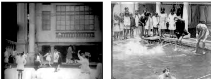
Fig. 34. Actividades escolares en el 24 de Mayo. Fotogramas de Ecuador Noticiero, dirigido por Manuel Ocaña en 1929.

El Colegio de Niñas 24 de Mayo, creado en 1922, fue un puntal importante en la educación femenina laica en Quito, en la primera mitad del siglo XX. Este colegio constituyó una alternativa educativa frente a los colegios católicos tradicionales que habían prevalecido hasta ese momento. Si bien el 24 de Mayo actualmente y desde hace muchos años, es un colegio público en el que se educan capas medias y populares, en sus inicios estuvo concurrido sobre todo por hijas de familias liberales de sectores medios y altos, que formaban parte de lo que en ese entonces se llamaba “gente decente”, aunque no tuvieran grandes recursos económicos. Buena parte de las estudiantes provenían de provincias, pero existía un gran porcentaje de estudiantes quiteñas.