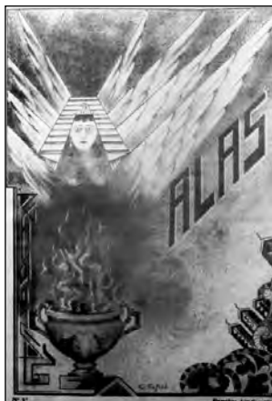
Fig. 49. Portada de la revista Alas , 1934.

Al final del texto editorial del primer número hicieron un llamamiento a las mujeres para promover su participación: "Mujeres ecuatorianas, mujeres indo ibéricas, para vosotras y por vosotras se ha fundado esta Revista. Acudid a embellecerla con las producciones de vuestro ingenio y de vuestro sentimiento, con el incontrastable vigor de vuestra delicada resistencia que es la fuerza y