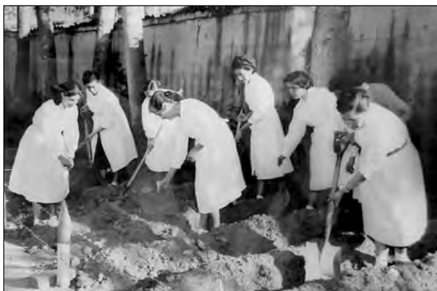
Fig. 8. Prácticas agrícolas. Biblioteca Colegio Manuela Cañizares.

1993:81). Los testimonios de alumnos de estas misiones señalan que los maestros alemanes fueron a veces demasiado rígidos, pero que su rigurosidad y exigencia también fueron aspectos formativos: “ellos nos enseñaron a ser responsables en nuestra profesión: la preparación de la clase, la elaboración del material a usar, la didáctica” Y si bien tuvieron un acercamiento humano con sus estudiantes, también hubo contradicciones. 30 Afirman que la enseñanza se impartía tomando como base la investigación, la observación y el énfasis en materias como la psicología -ciencia indispensable para la pedagogía- el trabajo manual, las ciencias naturales, la música y el canto, la participación conjunta de maestros y alumnos en las horas sociales, la realización de excursiones y paseos a pie al volcán Pichincha y a los alrededores de Quito, las prácticas agrícolas llevadas a cabo al interior de los colegios, entre otros (Fig. 8). La relación con el medio, con el entorno se trataba en la materia denominada “lugar natal”. Un aspecto también desarrollado por las dos misiones fue la educación física, que sería un antecedente para su incorporación a los planes educativos nacionales a partir de los años treinta.