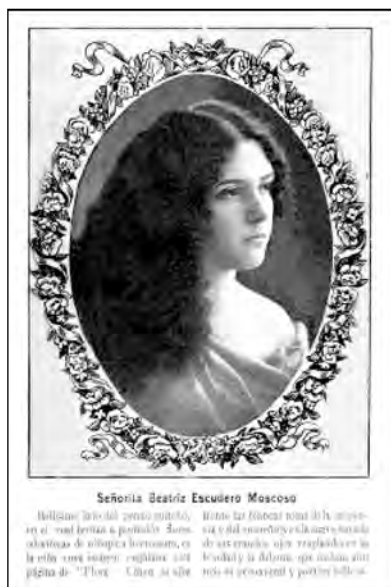
Fig. 45. Revista Flora .