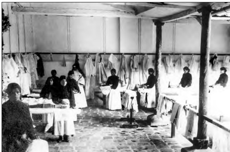
Fig. 1. Lavanderías de El Buen Pastor a inicios del siglo XX.

de la mujer en la sociedad se centraron en las elites y estuvo relacionada con su preparación para formar sus hijos en la vida doméstica. En cuanto a las mujeres de los sectores subalternos, sus roles se definían de modo práctico. Las mujeres indígenas en la ciudad, por ejemplo, formaron parte de la servidumbre doméstica, el comercio y los servicios, y según el Censo de la ciudad de Quito de 1906, su cantidad era importante. 20 Sin embargo, en la discusión oficial no eran tomadas en cuenta, no formaban parte de una preocupación ciudadana, a no ser en relación a las acciones benéficas. Igual se puede afirmar con respecto a las artesanas, trabajadoras de manufacturas y de la incipiente mano de obra fabril. Estaban enmarcadas en relaciones patriarcales, al mismo tiempo que sujetas a servidumbre o a condiciones precarias de trabajo. Este tipo de relaciones se definían de modo práctico en la vida cotidiana, no eran parte de lo público o de las discusiones públicas. Era de manera práctica como los ciudadanos blanco-mestizos establecían distintas formas de clasificación y de trato con las mujeres (y hombres) de los sectores subalternos. Se trataba de saberes incorporados: formas de relacionarse, de “saber mandar”, “educar”, “orientar”, “civilizar” y “cristianizar” en las que los ciudadanos se sentían investidos de autoridad. Hasta inicios del siglo XX estas relaciones esta-