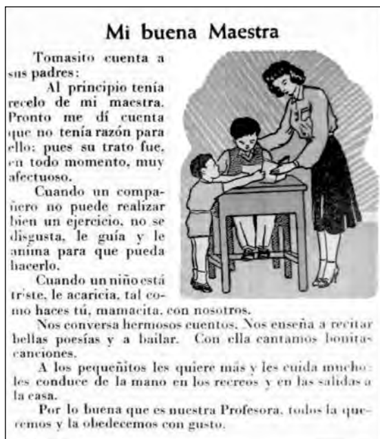
Fig. 42. Texto escolar Caminitos de Luz .

dar que no solo los niños sino las maestras leyeron continuamente esos textos).