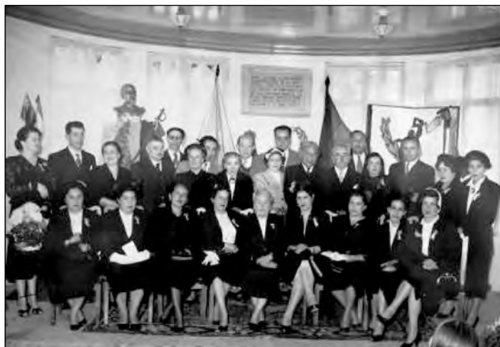
Fig. 31. Profesores y profesoras. Biblioteca Colegio Manuela Cañizares.