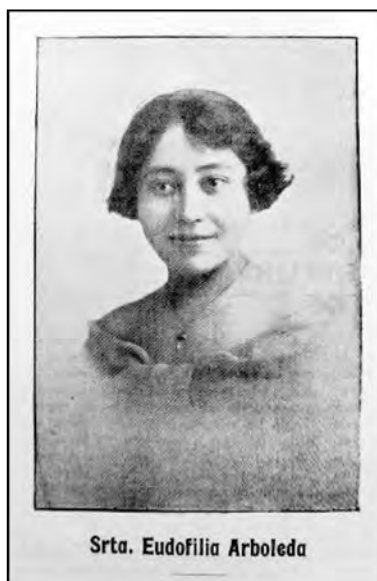
Fig. 22. Revista Magisterio Ecuatoriano . Quito.

futuras educadoras. Debo si, confesar, que puedo haberme equivocado al querer implantar este sistema de disciplina, pero juzgué llegada la hora de desterrar la disciplina nacida del miedo y permanezco fiel a mi criterio del verdadero concepto de disciplina” (Arboleda 1932 cita Herdoíza 1951: 276). Retomando a Norbert Elías (1995) se puede hablar de cambios en las estructuras de sensibilidad desde adentro, en lugar de hacerlo a partir de coacciones externas. Uno y otro tipo de acción disciplinaria no eran en todo caso externas. Para desarrollar actitudes y comportamientos como los señalados, las maestras debían tener una vigilancia constante pero también una auto vigilancia. Esto estaba relacionado con la acción pedagógica pero también con la necesidad de “manejar las impresiones” y generar una nueva imagen de sí mismas.