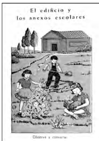
Fig. 19. Caminitos de Luz .