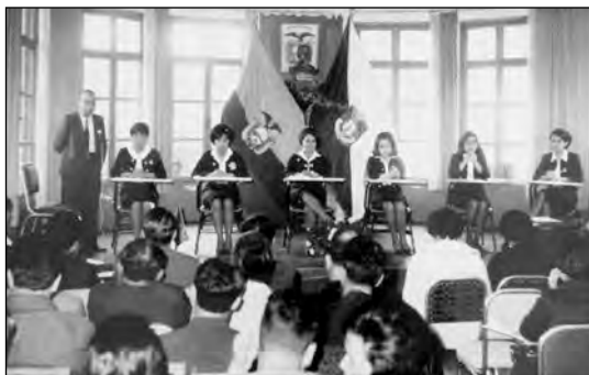
Fig. 33. Debate estudiantil. Biblioteca Colegio Manuela Cañizares.

Los certámenes habían sido utilizados como recurso pedagógico y de difusión del pensamiento católico, sobre todo por los jesuitas, mientras que aquí estaban relacionadas con preocupaciones seculares, educativas, sociales y médicas. Lo más probable es que los temas de los debates no hayan sido definidos por las estudiantes, sino por las maestras en respuesta a preocupaciones ciudadanas de las que ellas mismas eran partícipes: las condiciones de mejoramiento social o individual, la enseñanza pedagógica, la higiene. Pero lo que quiero enfatizar es que a través de estos actos se motivaba a las estudiantes a participar en la vida social y pública. Trato de imaginar el inmenso esfuerzo que suponía organizar cada una de esas sesiones y la importancia que daba el colegio a ello. Un debate es una forma de representación, un evento abierto al público como espectáculo teatral, una extensión de la sabatina escolar pero a otro nivel, no repercute en la opinión pública pero constituye un ensayo para participar en ella. Está organizado de manera formal y ceremonial, como un ritual capaz de instituir una autoridad.