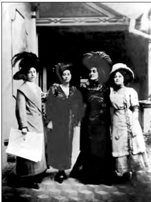
Fig. 6. Miembros del Conservatorio.

del normal Manuela Cañizares (1901) que las maestras fueron adquiriendo legitimación y mayor nivel de profesionalización. También el gobierno liberal abrió cursos especiales para señoritas en el Conservatorio Nacional de Música (Fig. 6) y en la Escuela de Bellas Artes fomentando además, por medio de becas, los estudios de obstetricia y el ingreso a la Facultad de Farmacia.