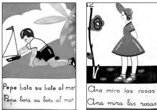
Fig. 18. Semillitas , Libro único para primer grado .