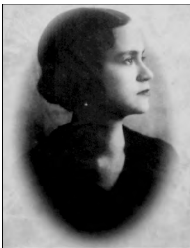
Fig. 51. Matilde Hidalgo de Procel.

para gozar del derecho de dar su voto en las elecciones, consulta originada en el caso concreto de que una señora se había inscrito en los catastros electorales, ha hecho que el H. Consejo de Estado afirme y defina la jurisprudencia en tan importante materia. Según la citada corporación, son ciudadanos las mujeres al igual que los hombres pues la Constitución no distingue de sexos cuando determina las condiciones de la ciudadanía –tener veintiún años de edad y saber leer y escribir- y el ejercicio del derecho del sufragio no requiere otro requisito que el hallarse los individuos en pleno goce de dicha ciudadanía. 44