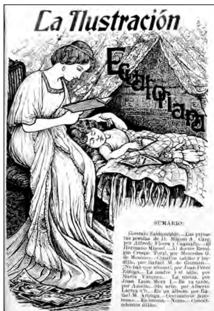
Fig. 4. Revista La Ilustración Ecuatoriana No.19, Quito, 1910.

sectores sociales altos, fueron muy exigentes en su uso. 40 En los programas de enseñanza de estos colegios, se lo estudiaba en la materia urbanidad una hora por semana durante todos los años. 41