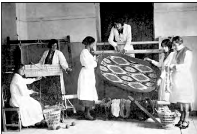
Fig. 37. Actividades Manuales. Bodas de Oro. Fernández Madrid en el Corazón de Quito, 1830-1940.

Escuela, 245 fueron varones y 62 mujeres. La sección femenina comprendía (de igual manera que la masculina) el estudio de algunas materias básicas, conjuntamente con la teoría y práctica del taller. En 1935 se separó la sección femenina y se convirtió en una escuela independiente, bajo el nombre de Escuela Profesional de Señoritas. Se implementaron talleres de corte y confección, labores y bordado a máquina y tejido de alfombras