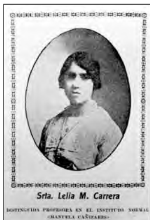
Fig. 26. Revista El Magisterio Ecuatoriano . Quito.

Uno de los aspectos importantes de la labor de los normales fue la generación de un modelo de mujer y maestra distinto a los anteriores. Esto se expresaba en la formación de modelos o referentes y que se ponía en evidencia no solo en aspectos formativos y dispositivos morales, sino en una gestualidad y en una postura física.