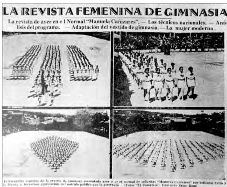
Fig. 12. El Comercio , 13 de junio de 1937.

confianza en sí, nace el optimismo, que es el cimiento de la felicidad”. También planteó que “la educación física despierta y ejercita la capacidad de observación y acrecienta el valor. Un buen gimnasta se halla capacitado para resoluciones prontas y actuaciones precisas y es resistente a las fatigas y a los sufrimientos morales. Por medio del ejercicio se conquista la salud, a la vez que con el vigor físico se tonifica el espíritu”. Habría que preguntarse cómo estos planteamientos fueron procesados internamente, por ejemplo, si las excursiones escolares, que eran parte del mismo programa educativo ¿no ayudaban a la formación de individuos activos útiles para la vida moderna y, al mismo tiempo, enriquecidos con el contacto de la naturaleza y el medio ambiente? Como se verá más adelante, las maestras buscaron en sus estudiantes el desarrollo de comportamientos distintos a los que tradicionalmente habían tenido las mujeres, modificar sus actitudes corporales y construir un tipo de mujer activa y afirmativa tanto en términos sociales como de género.