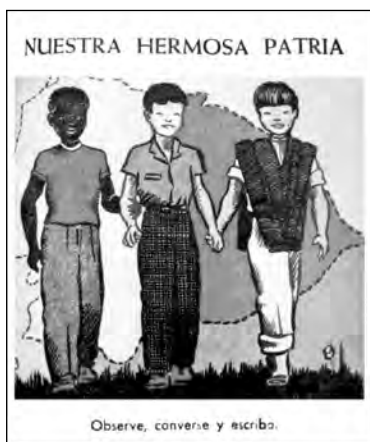
Fig. 20. Caminitos de Luz , libro de lectura de segundo grado.

(1951:136) señalaba como un punto a favor de la educación de los normales el dar un carácter nacional a la educación y haber “extendido la cultura fundamental” a todos los rincones del país, aún de los parajes selváticos, dando en todo momento y a todos los grupos humanos la sensación de Patria, “una y grande” de hecho estaba proponiendo un proyecto de homogenización cultural. Pero no hay que perder de vista que lo hizo en el contexto de una sociedad que continuaba siendo de castas y privilegios estamentales, aunque había entrado a modernizarse. La incorporación de nuevos sectores sociales a la idea de nación podía contribuir a cambiar esas condiciones (Fig. 20). Cuando señalaba que el proyecto educativo nacional que ellos defendían dio “preferencia a la historia y la geografía nacionales, poniendo al Ecuador como epicentro del mundo y como término de comparación y de relación con otros países, pues era necesario dar a conocer a los ecuatorianos quienes somos y en que medio geográfico vivimos con la obligación de hacer Patria”, planteaba que era en oposición al “desconocimiento de nuestros valores nacionales y el complejo de inferioridad que caracteriza a la generalidad de personas de nuestras elites sociales” (Torres 1951: 111).