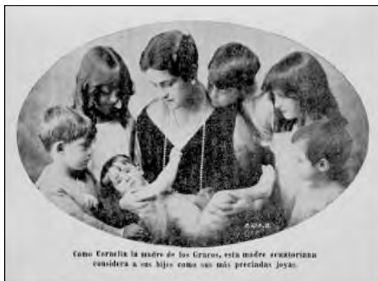
Fig. 11. AHM, Fotografía en Carlos Sánchez, Breves nociones de Puericultura , Imprenta de la Universidad Central, 1928.

Se recalcó que no era un concurso de “niños gordos”, sino de “madres cuidadosas”. Se decía que se trataba de evitar y prevenir la mortalidad infantil creando la “Casa de la Madre” para los sectores populares. 15 Las políticas de protección a la infancia no fueron ajenas a las condiciones concretas del país, a la crisis económica existente y al alto índice de mortalidad pero eran resultado, sobre todo, de un nuevo horizonte mental que asignaba al estado el cuidado de las poblaciones y convertía a las familias y a las madres en agentes intermediarios de las acciones estatales. Además, las familias empezaban a estar vinculadas a la escuela y a los centros de salud y protección infantil. Es cierto que eso obedecía a una situación real en esos años pues los índices de mortalidad infantil hasta los 10 años oscilaban alrededor del 40%, lo cual significaba que la mitad de las defunciones correspondía a niños menores de esa edad pero, al mismo tiempo, se había desarrollado una nueva visión estatal que cambió la percepción sobre las mujeres y las políticas con respecto a ellas. Es posible que en épocas anteriores hayan existido condiciones de mortalidad y salubridad semejantes o aún peores, pero hasta este momento no habían sido visibilizadas o puestas de relieve por las investigaciones de los higienistas, médicos y maestros, ni por los sistemas asistenciales estatales.