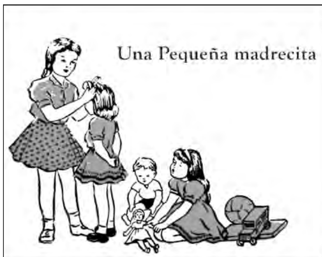
Fig. 43. Texto escolar Caminitos de Luz .

Mis papás no querían que yo sea profesora, pero yo me hice profesora por vocación, porque me gustaba, desde niña mis juegos fueron sobre la escuela y yo era la maestra... 4