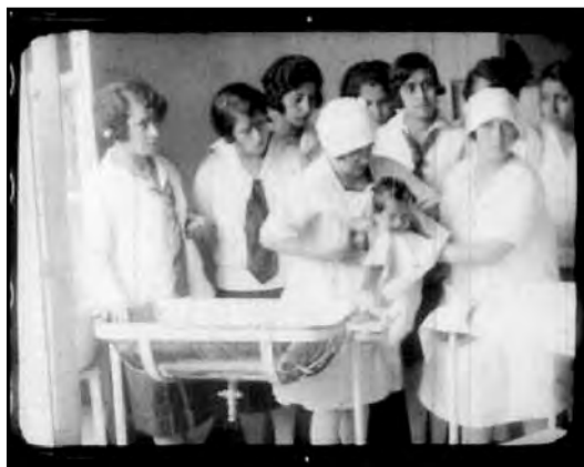
Fig. 25. Clase Práctica de Puericultura en el Colegio Manuela Cañizares. Fotograma de Ecuador Noticiero, dirigido por Manuel Ocaña en 1929.