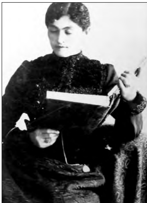
Fig. 2. Señora con libro.

100 pesos de multa. Igualmente en el caso de que una escuela de niñas esté bajo la dirección de un hombre”. 30 Sin embargo, no se puede dejar de señalar que a pesar de que esta medida tuvo una connotación moral, en la práctica favoreció la inserción de las mujeres en el espacio educativo como preceptoras, proceso que se profundizaría en la época liberal. Muchas mujeres descubrieron a partir de ahí el gusto por las bellas artes y los libros, aunque el mismo haya comenzado por textos y lecturas de tipo religioso.