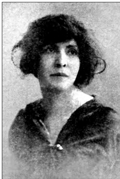
Fig. 7. Zoila Ugarte de Landívar

También fue directora de la Biblioteca Nacional y maestra del normal Manuela Cañizares y de los liceos Fernández Madrid y Simón Bolívar. En 1905 ella planteó que las mujeres debían ser colocadas en un puesto de igualdad por el perfeccionamiento de sus facultades. Como liberal utilizó la imagen de la luz para defender este derecho: