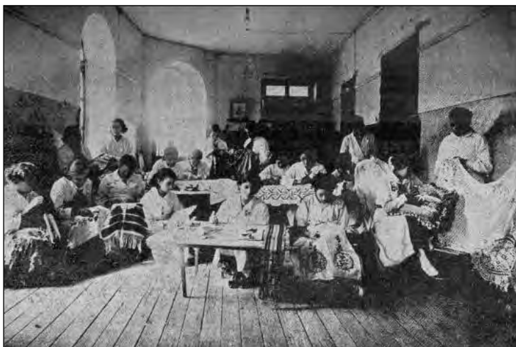
Fig. 39. Actividades manuales. Liceo Municipal Fernández Madrid (1937). 38