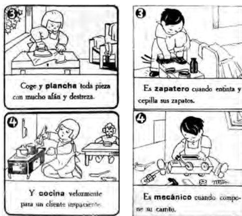
Fig. 17. Semillitas , Libro único para primer grado.

En los “Oficios de Ovidio” en cambio: “Es sastre cuando pega un botón. Es carpintero si pone clavos en una tabla y hace un ropero. Es zapatero cuando entinta y cepilla sus zapatos. Es mecánico cuando compone su carrito. Es herrero cuando endereza un clavo. Es agricultor cuando riega las plantas de la huerta”. Se valorizan las actividades manuales artesanales y agrícolas, como parte del proceso de formación de una cultura nacional democrática, pero de ello no participan las niñas. Las actitudes de las niñas, con excepción de las tareas domésticas, son en su mayoría pasivas: mientras “Ana mira las rosas”, “Pepe salta la llama”, “Pepe bota su bote al mar” (Fig. 18).