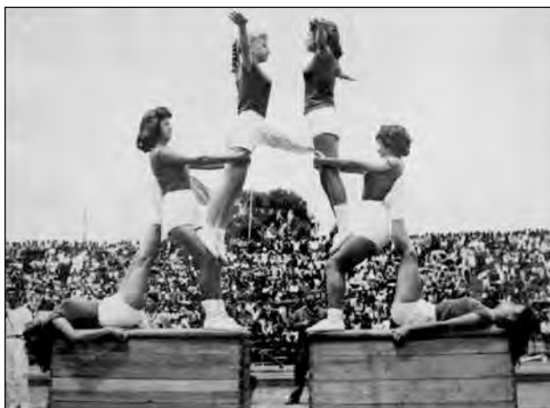
Fig. 24. Revista de Gimnasia. Biblioteca Colegio Manuela Cañizares.

mujer) debían estar dirigidos primordialmente a “hacer una mujer sana, vigorosa y armoniosa, es decir una mujer que sepa sentir la necesidad del ejercicio físico, para que así alcance a sus hijos una vida sana y feliz”. 17