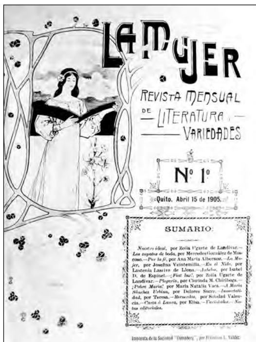
Fig. 47. Portada revista La Mujer , 1905.

para sostenerse sola?” Se trata de mujeres ilustradas que se sienten con el mismo derecho de los hombres para manifestarse de manera pública y dentro de un ámbito público (desde un nosotros) en nombre y representación del conjunto de mujeres. Quieren que la mujer sea colocada en un puesto de igualdad por el perfeccionamiento de sus facultades y por las posibilidades de una independencia económica.