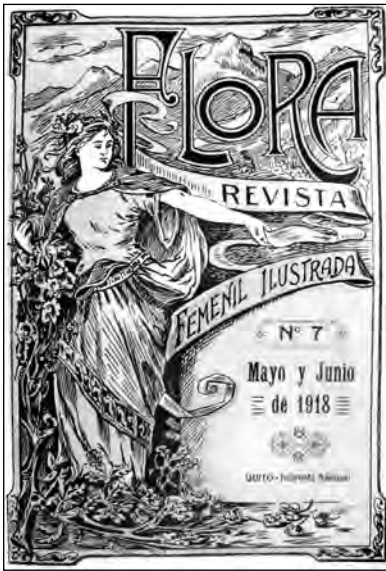
Fig. 48. Portada revista Flora .

La revista responde a un momento en el que la cultura ha pasado a constituirse como un espacio mundano, relativamente secularizado y en un recurso de acumulación de ciertas formas de capital simbólico pero bajo una hegemonía aristocrática. Intenta convertirse en un espacio literario femenino pero al mismo tiempo depende de sus suscriptores y de las noticias sociales (posiblemente pagadas). Su postura es, en este sentido ambigua. Aunque la dirección de la revista defiende la educación y la ilustración femenina, no cuestiona el rol aceptado por el “sentido común masculino” de las mujeres como esposas y madres cultas y católicas. En todo caso, lo interesante de la revista es que se trata de una