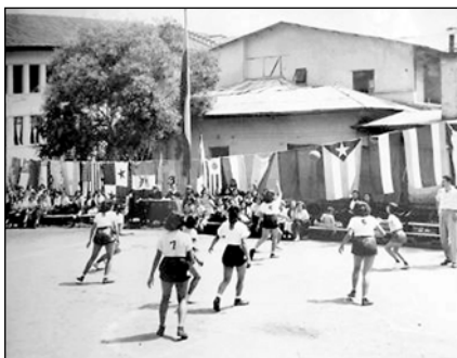
Fig. 32. Jornadas deportivas. Biblioteca Colegio Manuela Cañizares.

realidad, no pasaban... había que dar un examen terminando el tercer curso, para entrar al cuarto había que dar un examen de haber aprobado álgebra y gramática. Y temblábamos, porque ella era de las personas que abría la puerta de la clase -un rito tan singular no, ahora ya no se puede hacer eso- pero ella abría la puerta de la clase y nos tenía ordenado que tengamos la hoja de papel y la pluma listos para el examen de ortografía. No perdía un