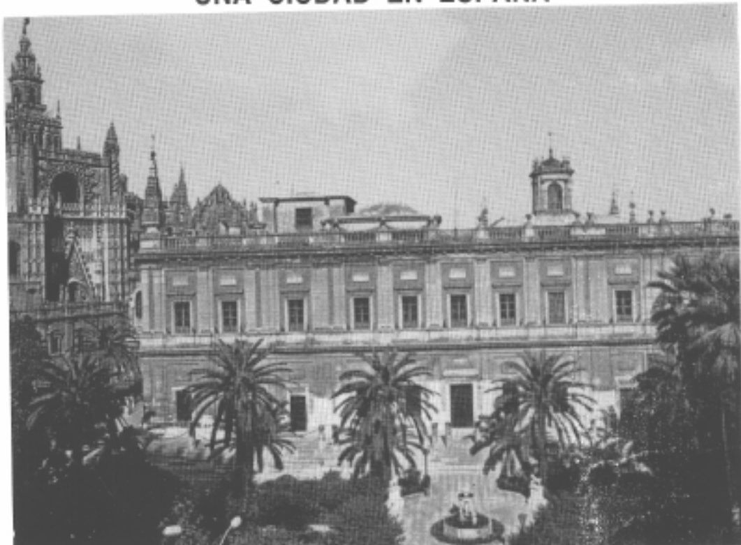
El Archivo General de las Indias en la ciudad de Sevilla