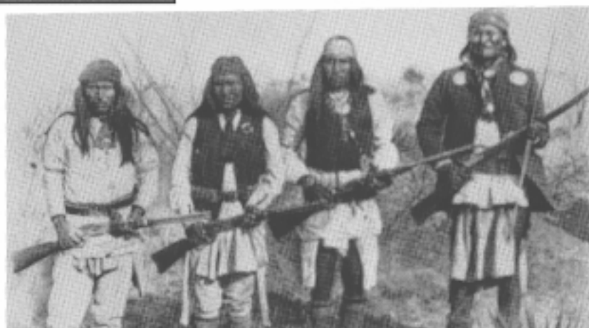
Un guerrero Chiricahua, el hijo de Gerónimo, otro guerrero, y Gerónimo