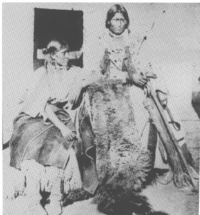
Indios Apaches-1874