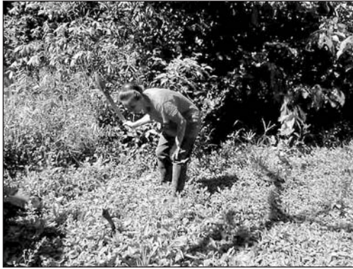
Sonia Flores rozando cacao