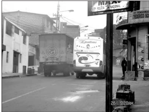
Las calles son estrechas y con tráfico intenso.