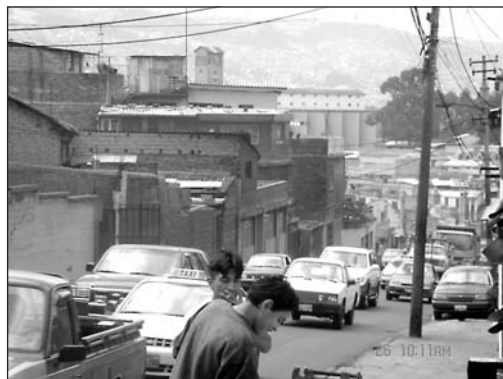
La gente utiliza las veredas para realizar su trabajo; la vía está saturada de vehículos permanentemente.