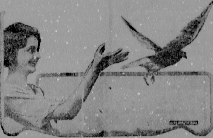
Una muchacha de Misuri en el acto de libentar a una paloma en la gran competencia de vuelo de 500 millas hasta St. Louis, Mo.