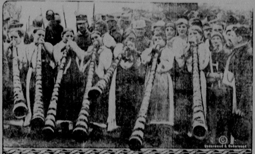
Las doncellas de Campeni en Transilvania dan la bienvenida al rey y la reina de Rumania sonando enormes trompas de palo.