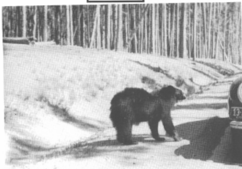
Un oso de color café, 1937