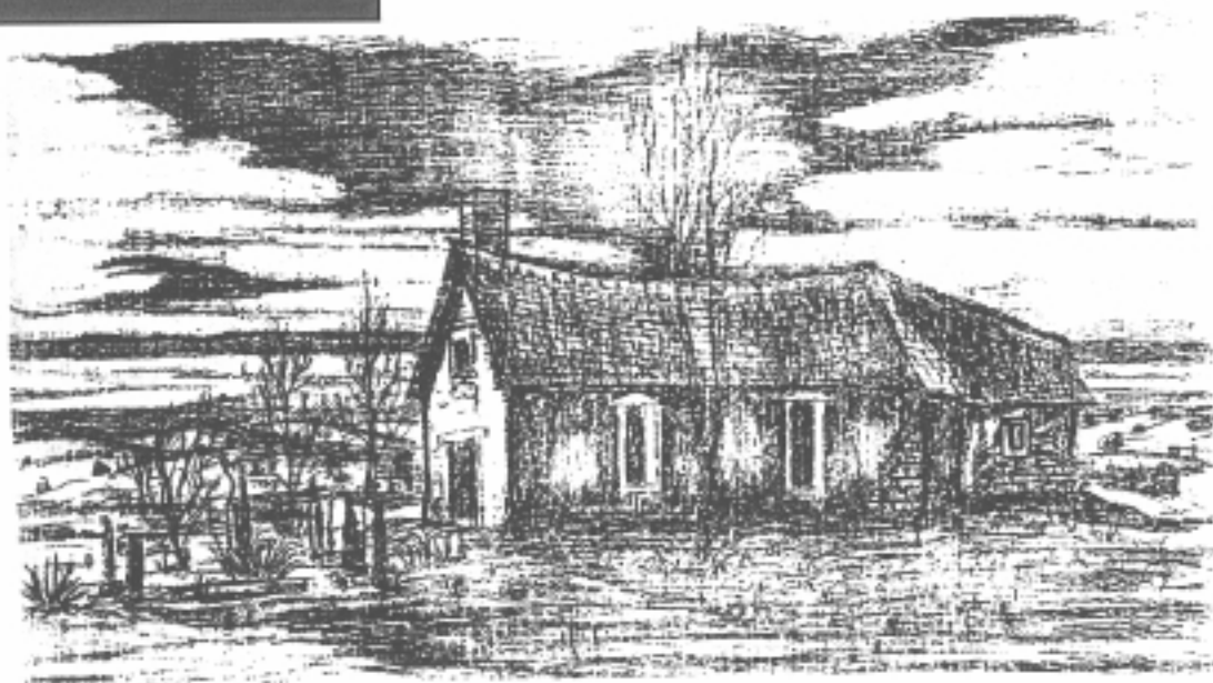
Santa Rosa de Lima Chapel Sketch by Santiago Chávez