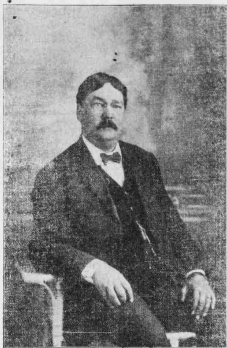
HON. ELFEGE BACA

DEDICADO A LOS MEJORES INTERESES DEL ESTADO DE NUEVO MEXICO EN GENERAL Y DEL CONDADO DE SAN MIGUEL EN PARTICULAR.