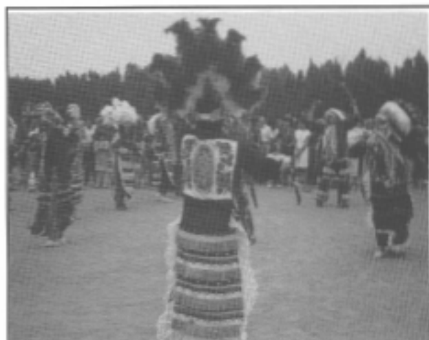
Indios Tortuga en Las Cruces, Nuevo México Una celebración del día de la Virgen de Guadalupe