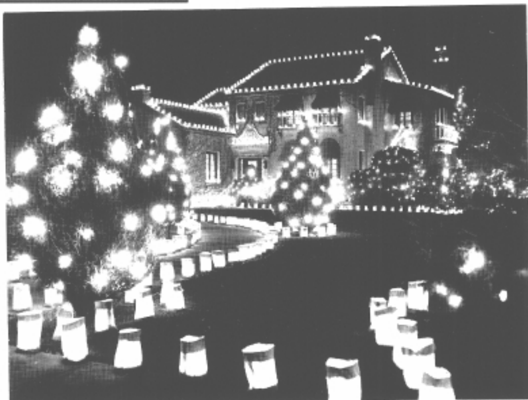
Farolitos en Albuquerque